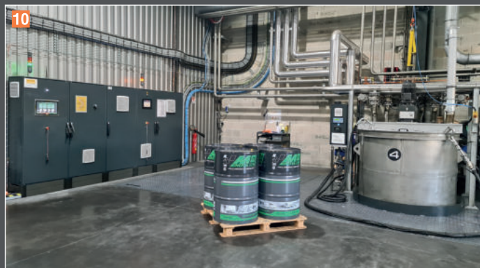
10 Quatre mélangeurs permettent d'arriver aux produits finaux.